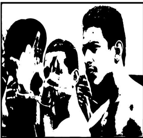
Imagen suministrada por el Coronel Rodríguez, Honduras 2018)

(Kenia Muñoz, 2015, recuperado de: https://prezi.com/mqnnbq0xaqjx/las-pandillas/ )