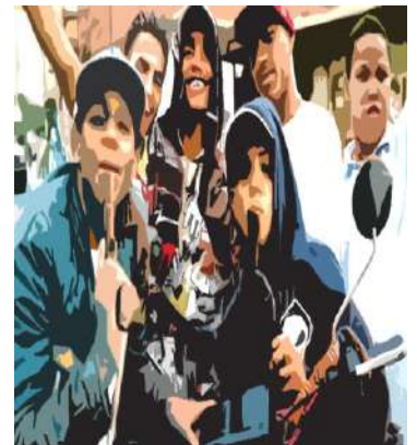
Imagen suministrada por el Coronel Rodríguez, Honduras 2018)

Son grupos de tres o más personas que se identifican por un bien común, estas pandillas son enlaces del crimen organizado desarrollando actividades de operatividad criminal de lo nacional a lo transnacional, con estructuras que buscan tener el control territorial para seguir actuando con recursos mal habidos, desafiando la Ley y el orden, razón por la cual, el Ministerio de Seguridad Pública (MINSEG) promueve el proyecto de Ley N°. 625 de Extinción de Dominio que busca acabar con los bienes ilícitos, con la finalidad de contrarrestar la capacidad económica y operativa de estas pandillas 1 .