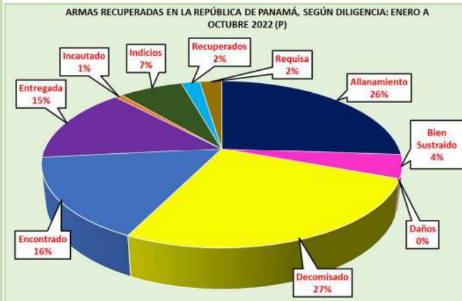
ARMAS RECUPERADAS EN LA REPÚBLICA DE PANAMÁ, SEGÚN DILIGENCIA: ENERO A OCTUBRE 2022

Se han recaudado hasta este mes un total de 54,538 municiones.