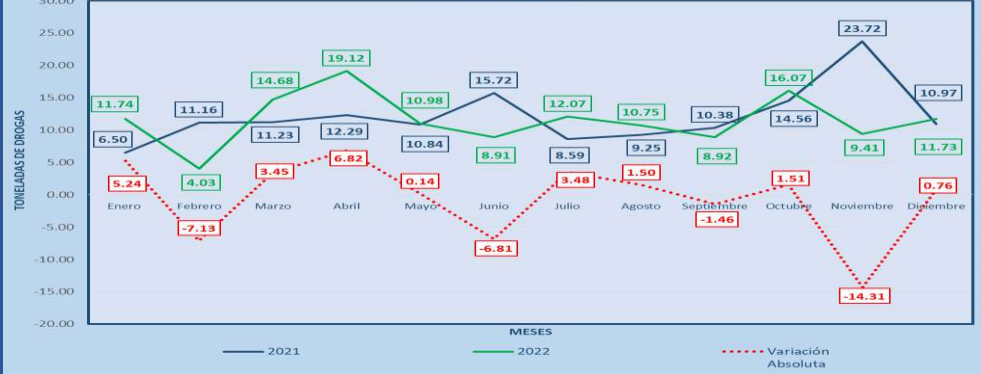
TOTAL DROGAS INCAUTADAS EN TONELADAS, SEGÚN TIPO: DE ENERO A DICIEMBRE DEL 2022