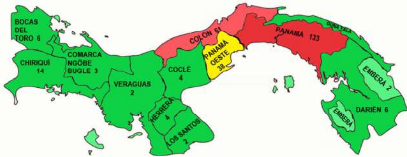
MAPA DE LOS HOMICIDIOS REGISTRADOS EN LA REPÚBLICA DE PANAMÁ: ENERO A JUNIO 2021